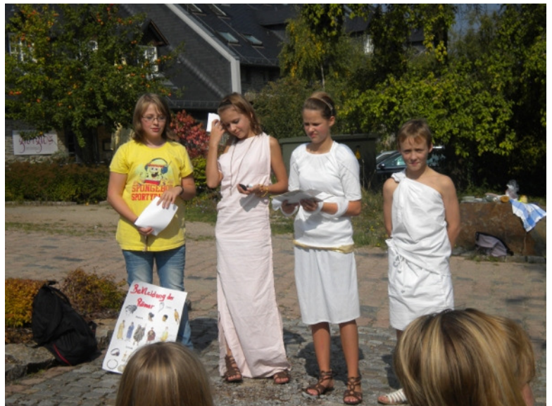
„Wie die alten Römer“. Kinder des Gymnasiums Taunusstein machten auf ihrer Zeitreise am Limes entlang Station auf dem Hofgut Georghthal, wo sie auch das Limes-Museum besuchten.

In den Jahrgangsstufen 7 und 8 fand die Projektwoche an Themen gebunden statt. Die „Zeitreise“ der Jahrgangsstufe 7 führte alle 5 Klassen aus der Römerzeit in die Welt des Mittelalters. Unterschiedlichste Aktivitäten vom Stationenlernen über Präsentationen und Exkursionen ließen bei den fast 160 Kinder dieses Jahrganges keine Langeweile aufkommen. Außerschulische Lernorte wie der Limes in der näheren Umgebung und die Stadt Mainz mit ihren vielfältigen Möglichkeiten der Begegnung mit der Römerzeit und dem Mittelalter, sowie ein Besuch auf der Marksburg am Rhein bereicherten die Zeitreise.